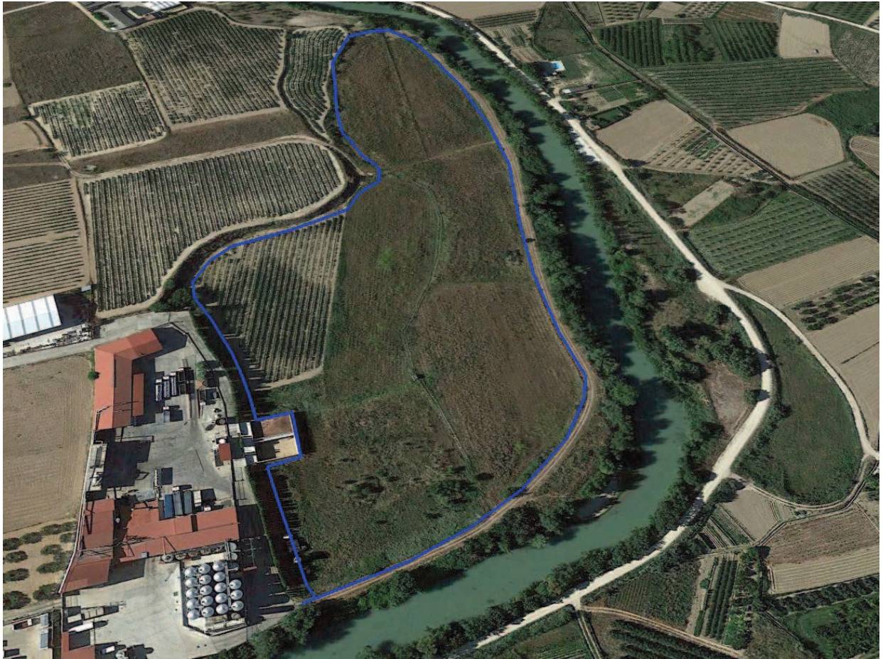
Delimitación de las balsas de infiltración sobre imagen de Google Earth y estado actual